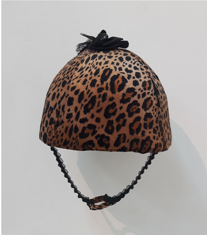
קסדה אופנתית לנשות ירושלים המאוחדת, 2016, גבס, בד, סרטים خوذة عصرية لنساء القدس الموحدة، 2016، جبص، قماش، شرائط Fashionable helmet for the women of The United Jerusalem, 2016, Plaster, fabric, ribbons, 33/26/24