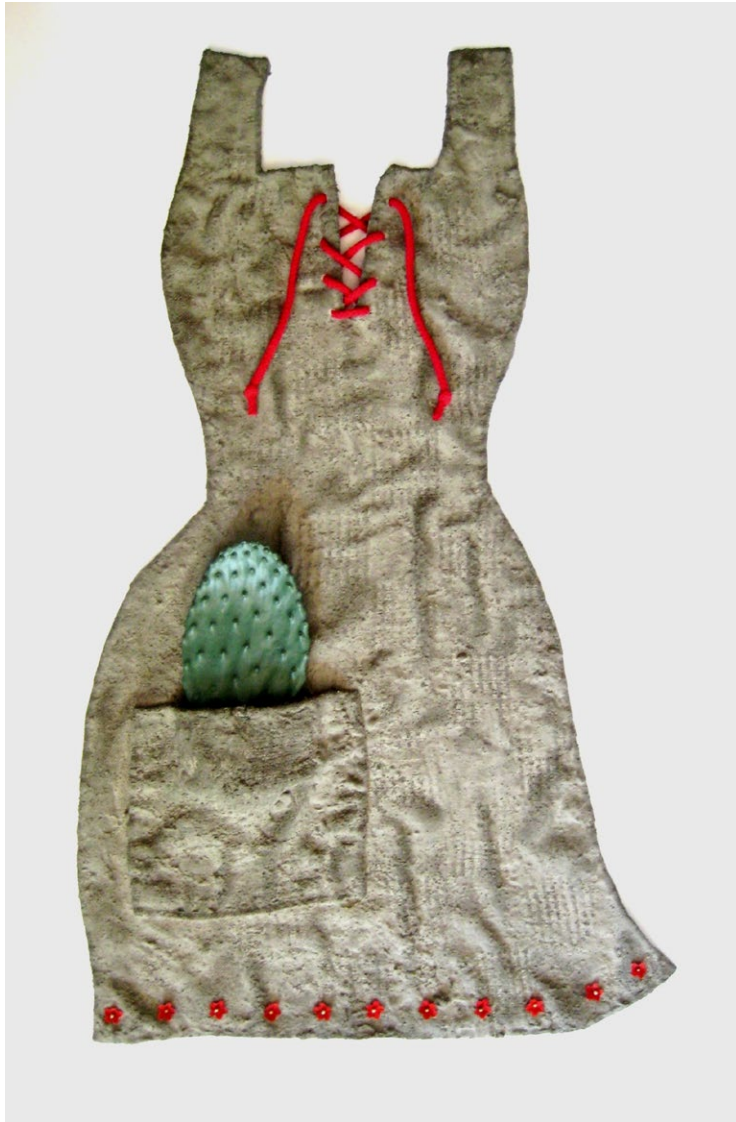
חלוצה, 2010, יציקת בטון, רדי מייד, חומר שרוף رائدة، 2010، باطون، ريدي مييد، مادة محروقة Tough pioneer, 2010, Concrete casting, Ready-made, burnt clay, 50/80