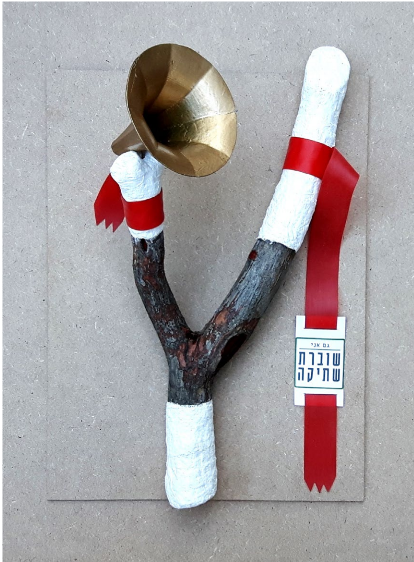
רוגנטקה שוברת שתיקה, 2017, עץ, גבס, רדי מייד مقلع كاسر الصمت، 2017، خشب، جبص، ريدي مييد A slingshot that breaks the silence, 2017, Mixed media, 52/25