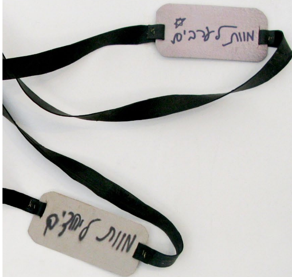
גרפיטי אַנְגֵז'ה, 2012, עץ, גומי, נייר جرافيتي ثنائي، 2012، خشب، مطاط، ورق Graffiti duet, 2012, Wood, rubber, paper, 5/20/35