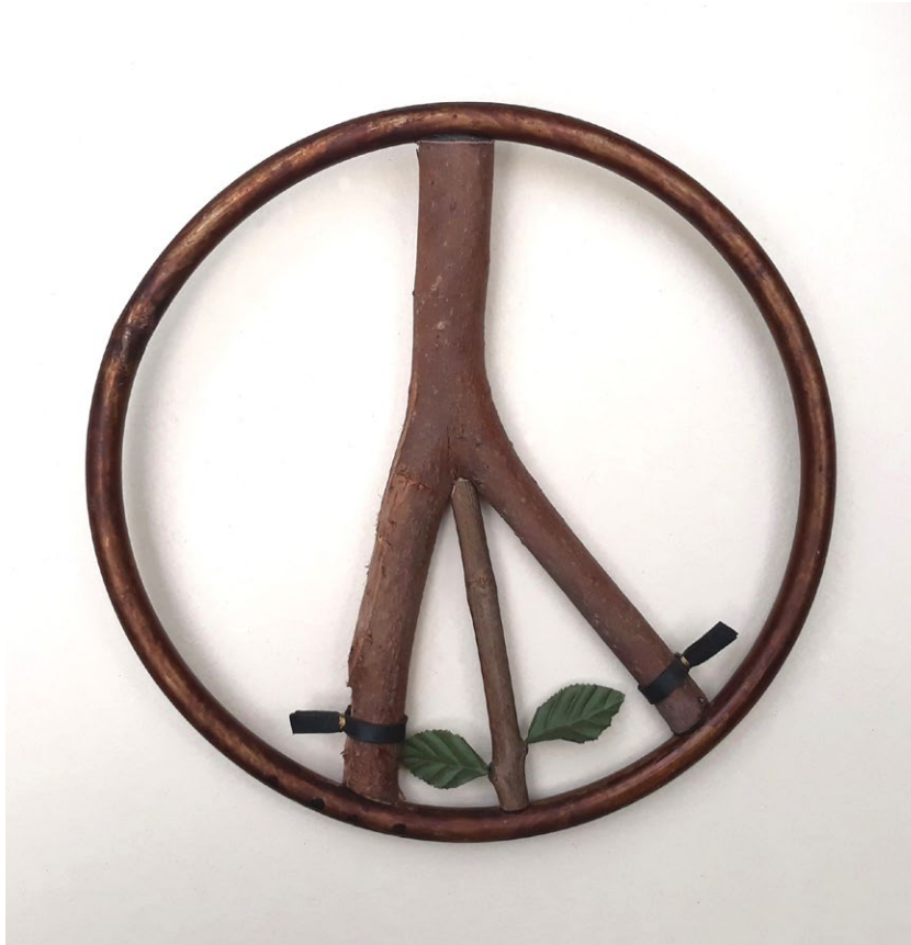
טכניקה מעורבת, 2012, A peace of art تقنية مختلطة، 2012، A peace of art A peace of art , 2012, Mixed media, 26.5 DM