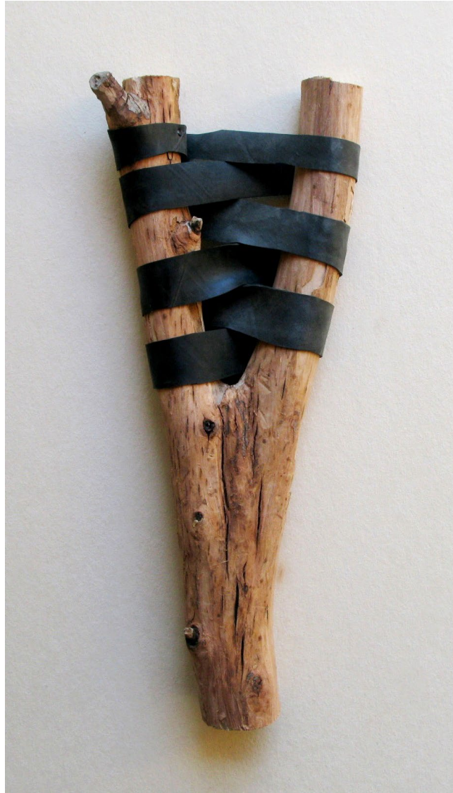
רוגטקה שמאלנית, 2014, עץ, גומי مقلع يساري، 2014، خشب ومطاط A left-wing slingshot, 2014, wood, rubber ,8/47/31