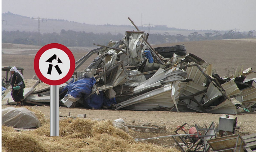
ללא כותרת (אל-עראקיב), 2017, עבודה דיגיטלית על קנבס بدون عنوان (العراقيب)، 2017، طباعة رقمية على قماش Untitled (AI – Araqeb) , 2017, Digital work on canvas, 50/90/12