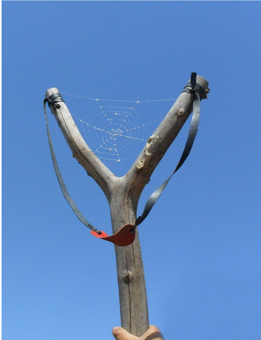
Hope , 2011, גומי, חוט דייגים Hope , 2011, خشب, مطاط, خيط صيادين Hope , 2011, Wood, rubber, fishing thread, 64/40