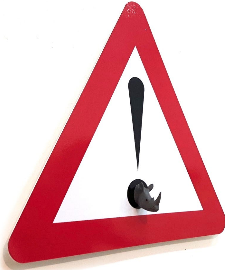
תמרור אזהרה מס' # 12, 2018, עבודה דיגיטלית + פריט רדי מייד, על PVC إشارة مرورية رقم # 12, 2018, طباعة رقمية مع ريدي مييد, على PVC Warning sign no. # 12, 2018, PVC on digital work + item Ready-made, 40/45