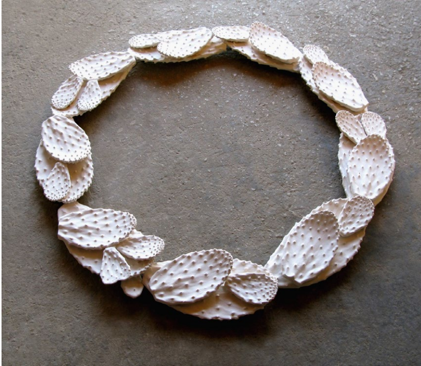
זר פירוס, 2012, חומר שרוף על שלד ברזל إكليل بيروس، 2012، مادة محروقة على هيكل حديدي Pyrrhus's Wreat, 2012, Scorched clay on an iron frame, 78 DM