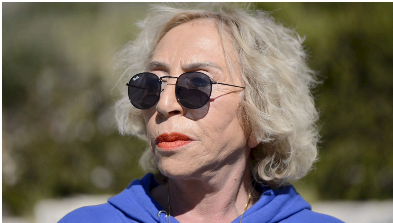
מאמות, 2024, פרט מתוך עבודת וידאו ארט | أمهات, 2024, جزء من عمل فيديو آرت | Maamot, 2024, Video art, detail