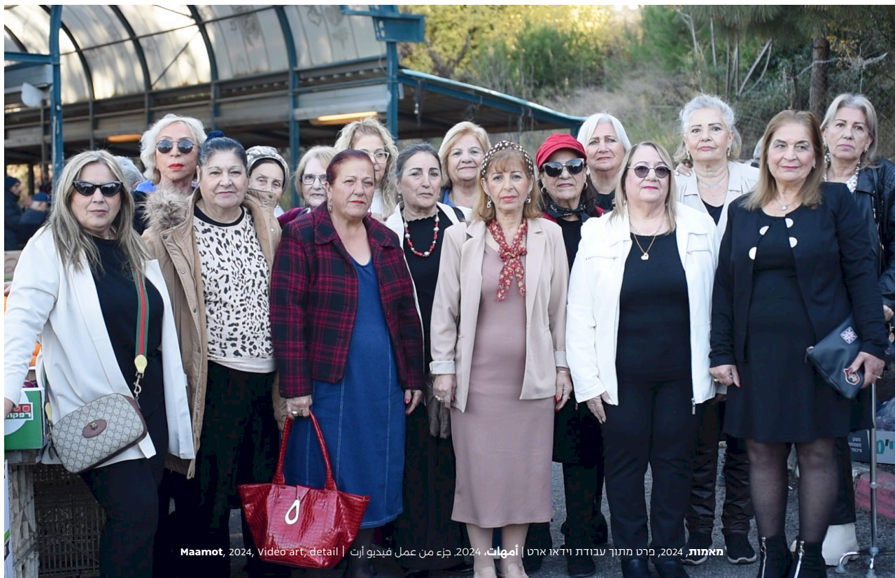
מאמות, 2024, פרט מתוך עבודת וידאו ארט | אמנות, 2024, جزء من عمل فيديو آرت | Maamot, 2024, Video art, detail