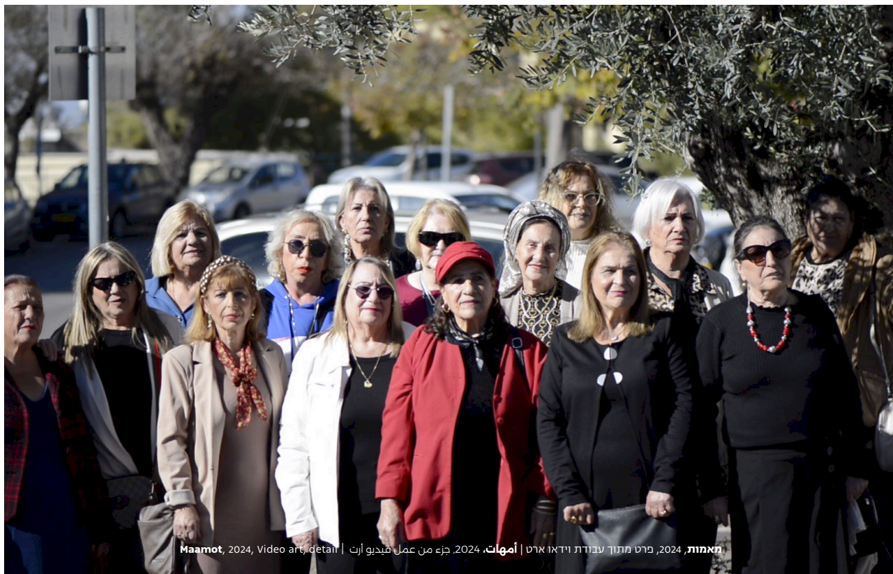
מאמות, 2024, פרט מתוך עבודת וידאו ארט | أمهات, 2024, جزء من عمل فيديو آرت | Maamot, 2024, Video art, detail