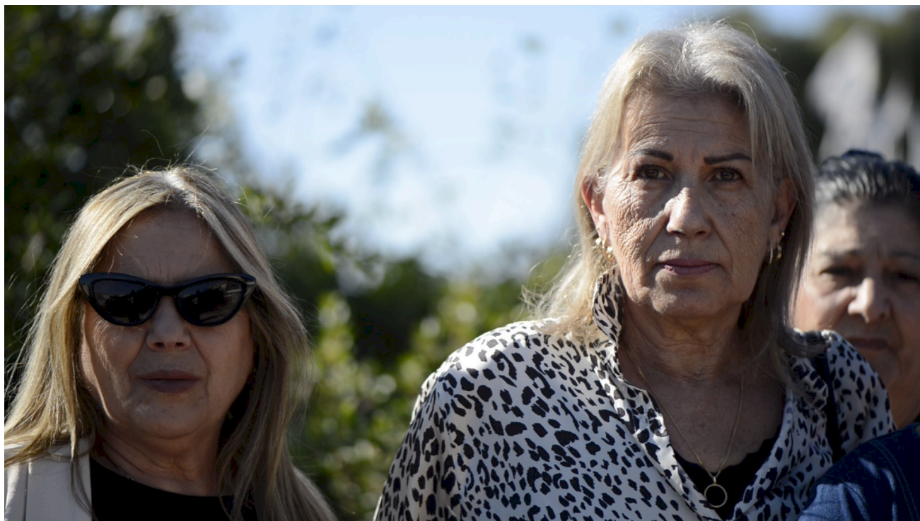
מאמות, 2024, פרט מתוך עבודת וידאו ארט | أمهات, 2024, جزء من عمل فيديو أرت | Maamot, 2024, Video art, detail