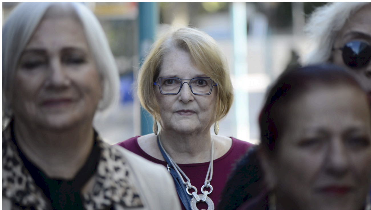
מאמות, 2024, פרט מתוך עבודת וידאו ארט | أمهات, 2024, جزء من عمل فيديو أرت | Maamot, 2024, Video art, detail